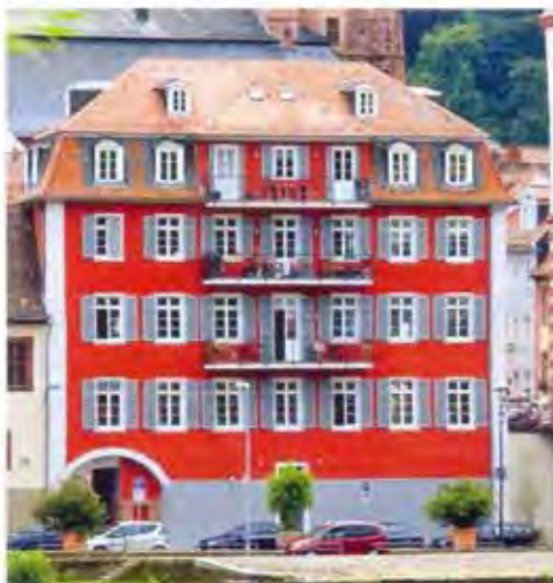
Altes Schulhaus an der Neckarbrücke Heidelberg Deutscher Fassadenpreis 2013 Jubiläumspreis-Fassadenpreis 2016